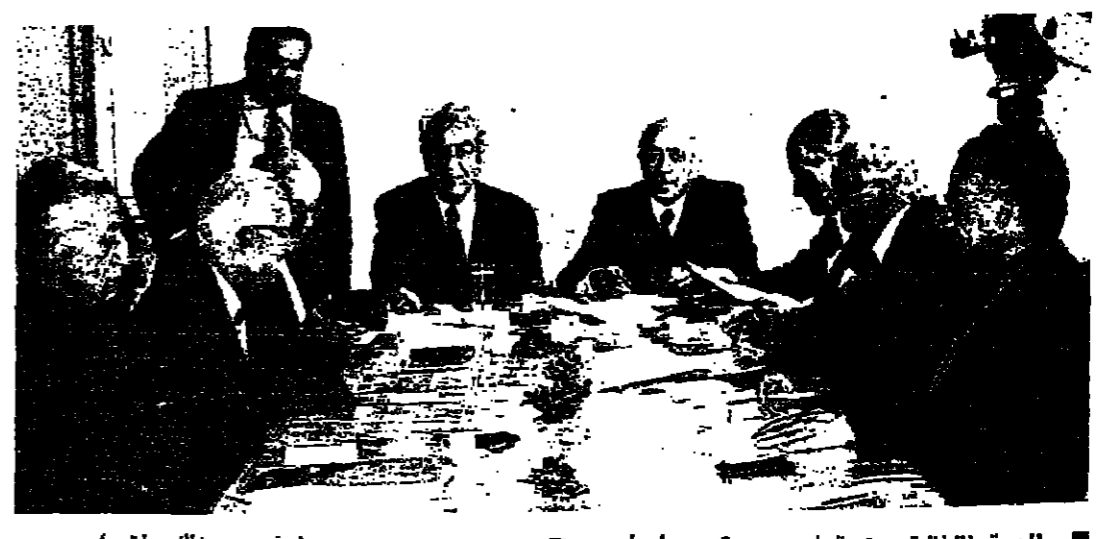
الاجتماع اللبناني المجتمعي في دير عوكر مساء أمس

اجتماع اللبناني المجتمعي في دير عوكر مساء أمس مجلس البحوث والدراسات التربوية اجتماع اللبناني المجتمعي في دير عوكر مساء أمس اجتماع اللبناني المجتمعي في دير عوكر مساء أمس